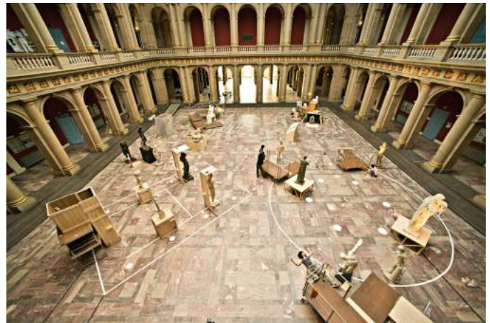
Doc. 2 – Deux photographies de l'exposition Via la Grèce